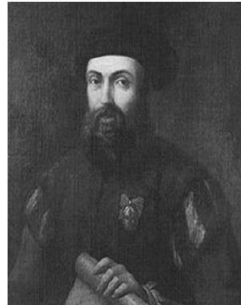
படம். 2.6 பெர்டினாண்ட் மாகெல்லன்

பெர்டினாண்ட் மாகெல்லன் தனது ஸ்பானிய குழுவினருடன் சுற்றுப்பயணத்தை மேற்கொண்ட முதலானவர் ஆவார். இதற்கிடையில், மற்ற ஸ்பானிய ஆராய்ச்சியாளர்கள் தென் பசிபிக் பிரதேசத்தின் அமெரிக்கா மற்றும் தீவு பகுதிகளை கண்டுபிடித்துள்ளனர்.