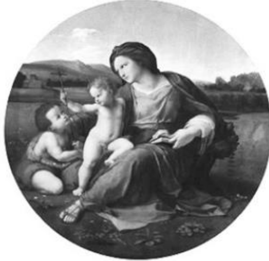
படம் 2.4 மடோனா மற்றும் குழந்தை

ரபேல் (கி.மு 1483-1520), மைக்கேலேஞ்சலோ மற்றும் லியோனார்டோ டா வின்சி ஆகியோரின் சமகாலத்தியவர், அவரது வேலை மடோனா மற்றும் அவரது குழந்தைக்காக பரவலாக கொண்டாடப்பட்டது.