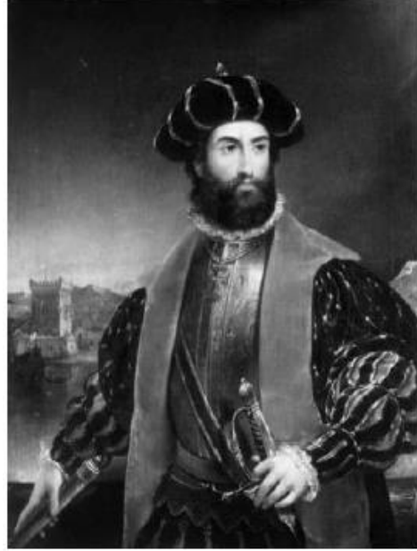
படம் 2.5 வாஸ்கோ ட காமா, 1498

1498 இல் புறப்பட்டு, வாஸ்கோ ட காமா இந்தியாவின் கடலோர பகுதியை அடைந்து, ஆசியாவுடன் வர்த்தகம் செய்வதற்கான ஒரு நேரடி வர்த்தக வழியை கண்டுபிடித்து வெற்றி பெற்றார்.