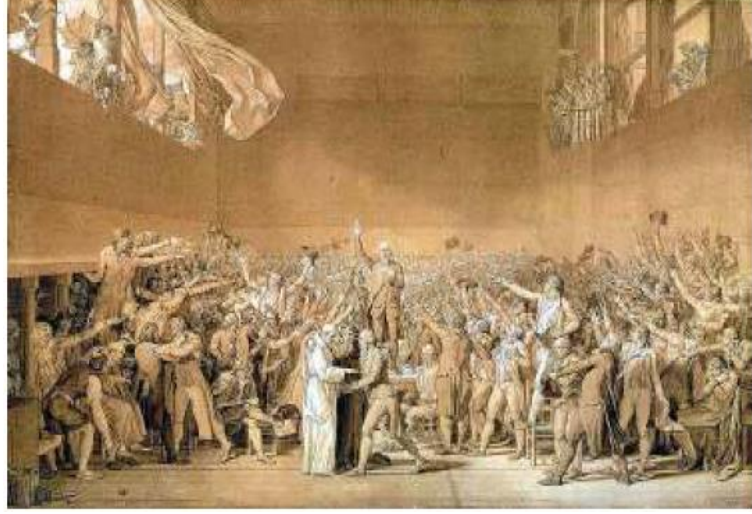
படம். 14.2 டென்னிஸ் நீதிமன்றத்தின் பிரமாணம்