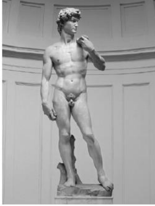
படம் 2.3 மைக்கேலேஞ்சலோவின் டேவிட்

ரபேல் (கி.மு 1483-1520), மைக்கேலேஞ்சலோ மற்றும் லியோனார்டோ டா வின்சி ஆகியோரின் சமகாலத்தியவர், அவரது வேலை மடோனா மற்றும் அவரது குழந்தைக்காக பரவலாக கொண்டாடப்பட்டது.