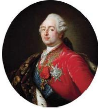
படம். 14.1 லூயிஸ் பிரபு XVI

லூயிஸ் XV லூயிஸ் XVI மூலம் (1774-1792) இல் வெற்றி பெற்றது. ஆரம்பத்தில் லூயிஸ் XVI இலிருந்து அதிக எதிர்பார்ப்பு இருந்தது ஏனெனில், வால்ட்டேரின் நண்பர் மற்றும் என்சைக்ளோபீடியின் பங்களிப்பாளரான அன்னை ராபர்ட் ஜாக்ஸ் துர்கோட் லூயிஸ் XIV இன் கீழ் நிதி மற்றும் கன்ட்ரோலர்-ஜெனரல் மந்திரியாக நியமிக்கப்பட்டார். லூயிஸ் XVI தனது முன்னோடி ஆட்சியின் கீழ் சோர்வடைந்த பின்னர் பிரான்சுக்கு ஒரு புதிய தொடக்கத்தை வழங்குவதற்கு தனது முயற்சியை மேற்கொண்டார். அறிவொளியூட்டும் கொள்கைகளைத் தொடர்ந்து, லூயிஸ் XVI சித்திரவதை, பாசிசம், நில வரி ஆகியவற்றை அகற்றினார் மற்றும் பிரிட்டனில் இருந்து சுதந்திரத்தை பெற அமெரிக்காவின் போராட்டத்தில் தீவிரமாக பங்கு பெற்றார். லூயிஸ் XVI ஆட்சியின் கீழ் மற்றும் துர்கோட் திசையில், தொழில் மற்றும் வர்த்தக கட்டுப்பாடுகள் விடுவிக்கப்பட்டன மற்றும் கீழ் வகுப்புகளின் வரி சுமையை வட்டி மற்றும் பங்குதாரர்களுக்கு வரியில் ஒரு பங்கை மாற்றுவதன் மூலம் குறைக்கப்பட்டது. இருப்பினும், மத குருமார்கள் மற்றும் பிரபுக்கள் ஆகியோரால் திருச்சபை நடவடிக்கைகள் எதிர்க்கப்பட்டன. விரோதப் பிரபுத்துவத்தை எதிர்கொண்டு, அவருடைய விருப்பத்தை கட்டாயமாக்குவதை தவறவிட்டார், 1776 இல் லூயிஸ் XVI ஐ துருக்கி நிராகரித்தார்.