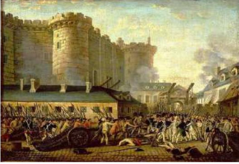
ஐரோப்பாவின் வரலாறு (1453 முதல் 1789 கி.பி. வரை)