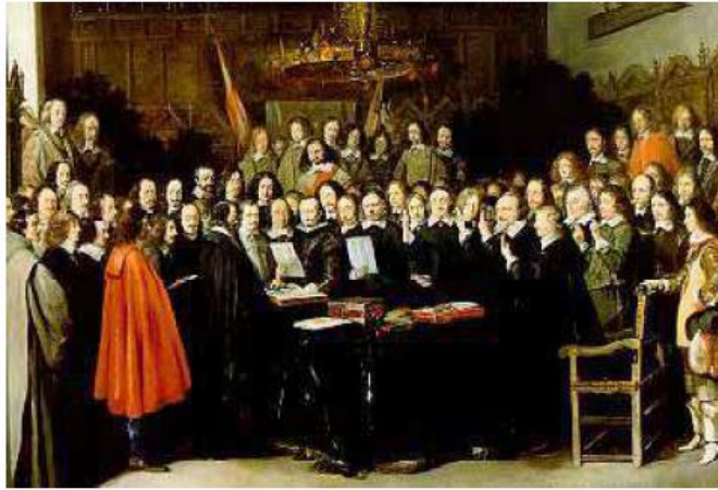
படம். 8.1 வெஸ்ட்பாலியாவின் அமைதியும், அக்டோபர் 1648

வெஸ்ட்பாலியாவின் அமைதியும் ஜெர்மனியின் இடையூறும் முற்றிலும் காட்டப்பட்டது; மத்திய அதிகாரத்தை மறைத்து விட்டது; ஹாப்ஸ்பர்க்கில் உள்ளூர் நிர்வாகிகள் காப்பாற்றப்பட்டு ஆற்றலற்ற தன்மையுடன் தாழ்ந்திருந்தார்கள். வடக்கு ஜெர்மனியில் பிரசியாவின் மோசமான உயர்வு மற்றும் தெற்கு ஜெர்மனியில் பவேரியாவின் தேசிய-விரோத சூழ்ச்சிகள் ஆகியவற்றிற்கு வழி திறக்கப்பட்டது.