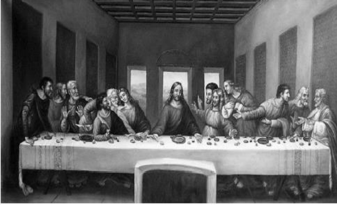
படம் 2.2 இறுதி இரவுணவு

இறுதி இரவுணவு என்பது சீடர்களின் எதிர்வினைகளை ஒப்பிடுகையில் கிறிஸ்துவின் அமைதியையும் சித்தரிக்கிற மற்றொரு தலைசிறந்த படைப்பாக உள்ளது. அவர்களிடமிருந்து ஒருவன் அவரைக் காட்டிக் கொடுப்பான் என்ற உண்மையை அவர் அறிந்திருக்கிறார்.