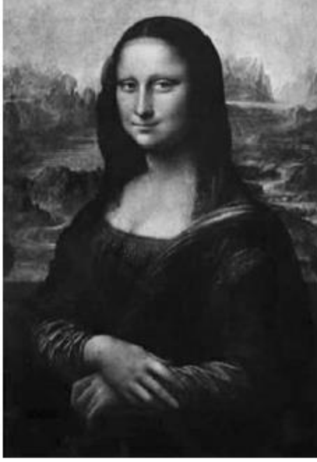
வரைபடம் 2.1 மோனா லிசா

இறுதி இரவுணவு என்பது சீடர்களின் எதிர்வினைகளை ஒப்பிடுகையில் கிறிஸ்துவின் அமைதியையும் சித்தரிக்கிற மற்றொரு தலைசிறந்த படைப்பாக உள்ளது. அவர்களிடமிருந்து ஒருவன் அவரைக் காட்டிக் கொடுப்பான் என்ற உண்மையை அவர் அறிந்திருக்கிறார்.